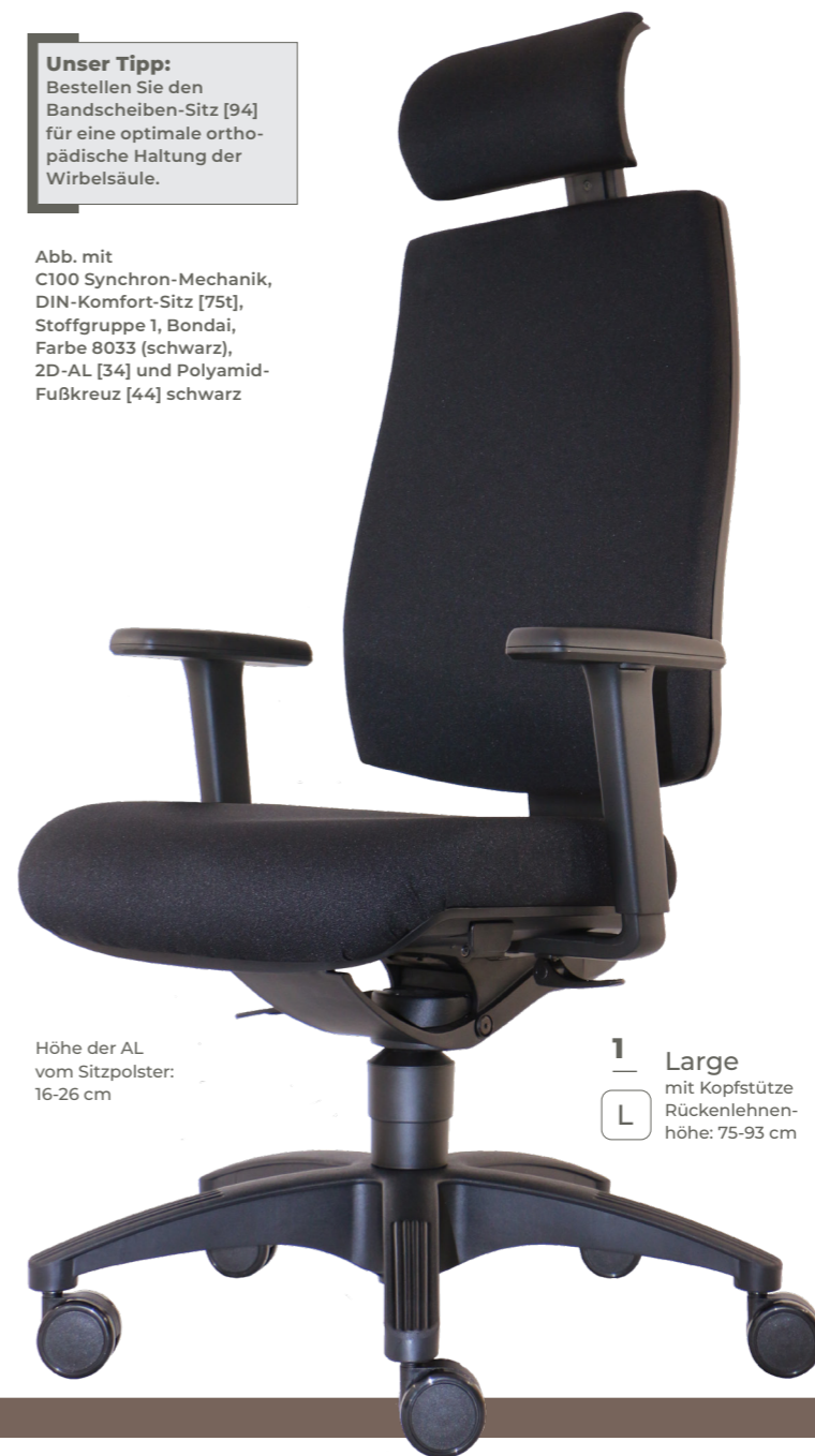
Abb. mit C100 Synchron-Mechanik, DIN-Komfort-Sitz [75t], Stoffgruppe 1, Bondai, Farbe 8033 (schwarz), 2D-AL [34] und Polyamid-Fußkreuz [44] schwarz

Unser Tipp: Bestellen Sie den Bandscheiben-Sitz [94] für eine optimale orthopädische Haltung der Wirbelsäule.